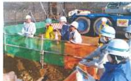
女性技術者交流会の現場見学 (R5.10.11)

10月 小樽開発建設部と小樽建設協会との女性技術者交流会 小樽未来創造高等学校現場見学会