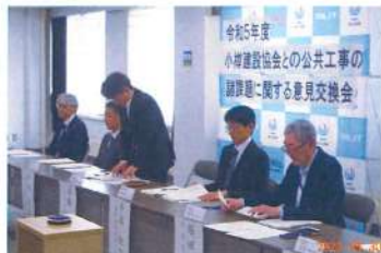
北海道開発局との 意見交換会 (R5.5.30)

5月 後志総合振興局との意見交換会 北海道横断自動車道(黒松内～小樽間)全線開通 に向けた勉強会 in 永田町 北海道開発局との意見交換会