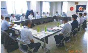
(小樽建設管理部) 維持管理業務に関する受託者との意見交換会(R5.7.30)

7月 後志総合振興局発注工事現場安全パトロール 維持管理業務に関する受託者との意見交換会 (小樽建設管理部)