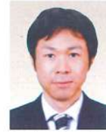
後志総合振興局 産業振興部長 <令和5年6月現職>

昭和63年4月 水産部振興計画課 令和4年4月 環境生活部アイヌ政策推進局 アイヌ政策課長