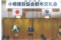
小樽建設協会新年交礼会 新年交礼会(R5.1.20) (グランドパーク小樽)

北海道建設部・小樽建設管理部との意見交換会 第一種酸素欠乏症に係る特別教育講習会 (小樽未来創造高等学校)