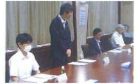
小樽開発建設部との意見交換会 (R5.8.8)