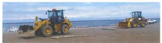
小樽市総合防災訓練(R5.8.31)