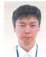
小樽労働基準監督署 俱知安支署 支署長 <令和6年4月現職>

平成元年4月 宮城労働基準局 仙台労働基準監督署 令和4年4月 北海道労働局労働基準部監督課 統括特別司法監督官