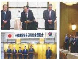
小樽建設協会通常総会(R5.12.19)