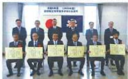
北海道建設部工事等優秀業者表彰伝達式外(R5.12.13)

12月 北海道開発局との意見交換会 北海道建設部工事等優秀業者表彰伝達式 小樽建設管理部工事優良企業・優秀現場代理人等表彰式