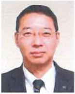
後志総合振興局 局長 <令和5年6月現職>

昭和58年4月 北海道開発局 釧路開発建設部 令和4年4月 北海道開発局 釧路開発建設部 釧路道路事務所長