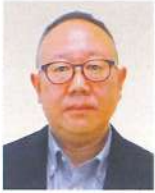
小樽開発建設部 次長(港湾・農業・水産担当) <令和6年4月現職>

平成12年4月 北海道開発局 建設部 令和3年7月 北海道開発局 釧路開発建設部 次長