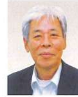
小樽開発建設部 技術管理官 <令和6年4月現職>

昭和60年4月 北海道開発局 室蘭開発建設部 令和5年4月 北海道開発局 稚内開発建設部 調査官