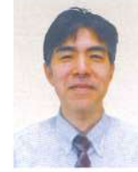
小樽開発建設部 次長(河川・道路担当) <令和6年4月現職>

昭和60年4月 北海道開発局 旭川開発建設部 令和4年4月 北海道開発局 開発監理部 人事課 人事企画官