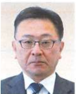
後志総合振興局 小樽建設管理部 事業室長 <令和6年4月現職>

昭和59年4月 函館土木現業所 令和3年4月 上川総合振興局旭川建設管理部 土別出張所長