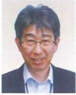
小樽開発建設部 部長 <令和5年7月現職>