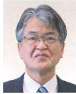
後志総合振興局 小樽建設管理部長 <令和6年4月現職>

平成7年4月 函館土木現業所 令和5年6月 総合政策部計画局計画推進課 社会資本・強靱化担当課長