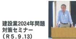
建設業2024年問題 対策セミナー (R5.9.13)