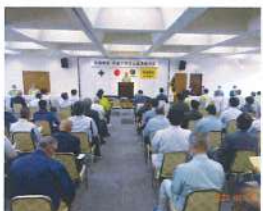
交通事故・労働災害防止総決起大会(小樽 R5.6.21)