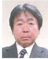
後志総合振興局 副局長(地域創生部、 保健環境部、産業振興部担当) <令和5年6月現職>