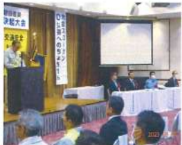
交通事故・労働災害防止総決起大会(倶知安 R5.6.14)