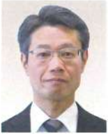
後志総合振興局 副局長(建設管理部担当) <令和6年4月現職>