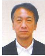
小樽開発建設部 調査官 <令和6年4月現職>

平成2年4月 北海道開発局 稚内開発建設部 令和5年4月 北海道開発局 小樽開発建設部 小樽港湾事務所長