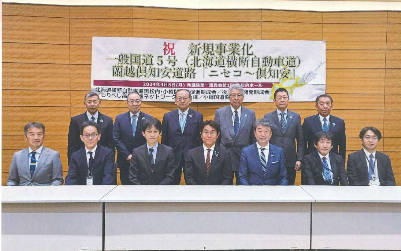
中村裕之衆議院議員、石橋林太郎国土交通大臣政務官はじめ国土交通省幹部(前列)の皆さんとともに

2024年4月8日、一般国道5号 北海道横断自動車道 蘭越倶知安道路「ニセコ～倶知安」新規事業化を祝して しりべし高速交通ネットワーク推進会議役員等(後列)で東京に行きました