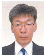
小樽労働基準監督署 署長 <令和5年4月現職>

平成5年11月 旭川土木現業所 令和5年6月 後志総合振興局 小樽建設管理部事業室地域調整課長