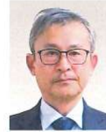
後志総合振興局 小樽建設管理部 用地管理室長 <令和5年6月現職>

平成2年4月 札幌土木現業所 令和4年4月 オホーツク総合振興局網走建設管理部 用地管理室長