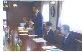
小樽建設管理部との意見交換会 (R5.8.1)

8月 小樽建設管理部との意見交換会 小樽開発建設部との意見交換会 北海道建設部・小樽建設管理部との意見交換会 小樽市総合防災訓練