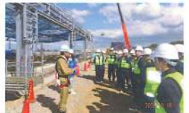
小樽未来創造高等学校現場 見学会(R5.10.16)