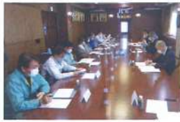
建設産業の現場の声を聞く 意見交換会(北海道建設部) (R5.1.17)