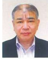
小樽開発建設部 次長(総務担当) <令和5年4月現職>

平成6年4月 北海道開発局 室蘭開発建設部 令和3年4月 国土交通省北海道局 地政課長